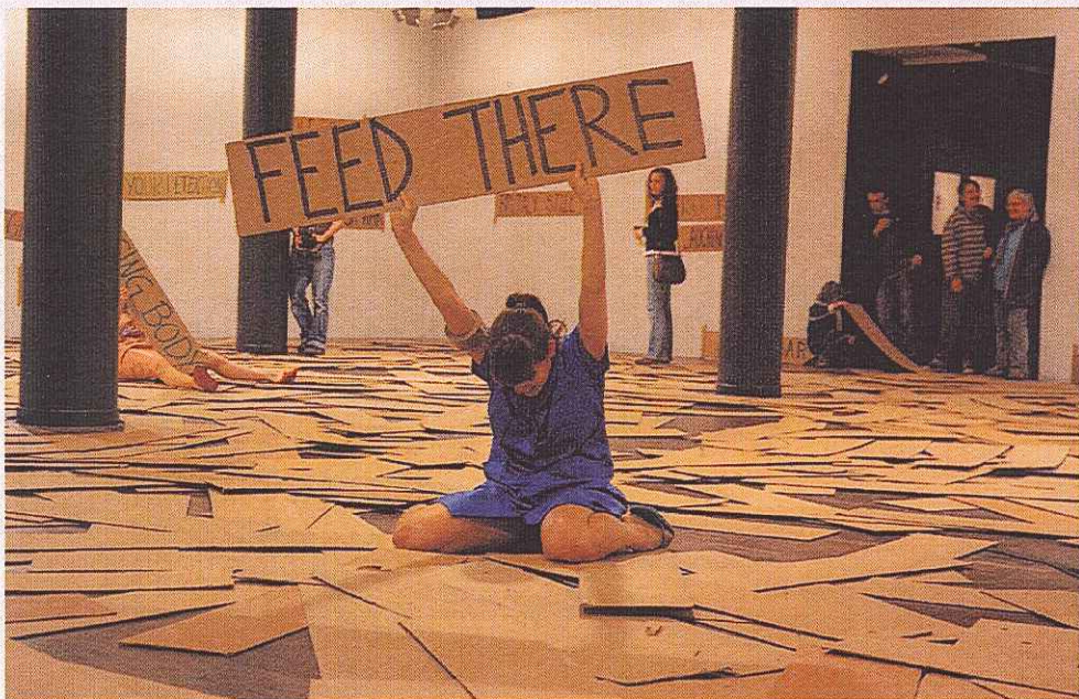
La Ribot Laughing Hole